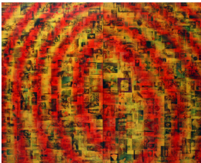
Google_Rouge/Jaune © PASCAL DOMBIS

L'artiste a participé à de nombreuses expositions en Europe, aux Etats-Unis et en Asie. Ses dernières installations à Paris ont eu lieu dans les galeries du Palais-Royal à l'automne 2010 où il a réalisé une oeuvre au sol de 250 mètres de long, et lors de la Nuit Blanche 2011, où il a présenté dans le coeur de la nef de l'Eglise Saint Eustache une installation de trois vidéos suspendues. Pascal Dombis vit et travaille à Paris. Il s'expose également à la galerie RX dans le 8e arrondissement à Paris jusqu'au 20 juillet.