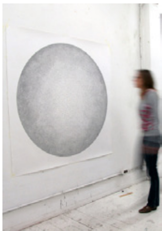
Sans titre — dessin à l'encre, une ligne. 2010 © Anne-Flore Cabanis

Né en 1977 à Saverne, vit et travaille dans le monde entier.