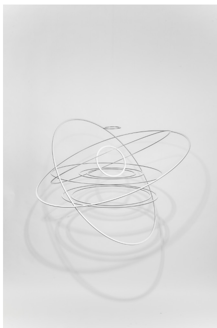
Circuconcentricos Blanco, 2011 © Elias Crespin.

Laurène D'Oria 01.40.67.00.38 laurene.doria@musee-en-herbe.com