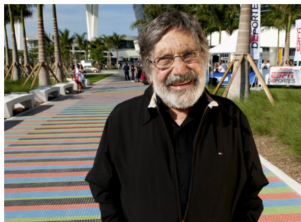
Carlos Cruz-Diez devant son Induction Chromatique à Double Fréquence. Miami, 2011-2012