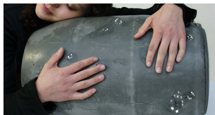
Barrel magique © MILÈNE GUERMONT

Elle y exposera entre autres choses, son Mur Nuées , ses Planets lumineuses ou encore ses Fondants au chocolat.