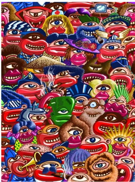
MAXIFOULE © Hervé Di Rosa