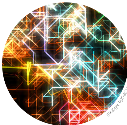
Détail © Logiciel Claude Michéniel