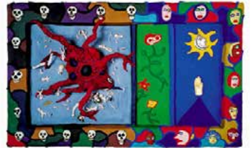
La Peste , Niki-de-St-Phalle, 1986

Niki de Saint Phalle aime piocher dans tous les trésors que recèle son atelier pour créer des oeuvres un peu folles peuplées de créatures fantastiques et bizarres. Les enfants réalisent une peinture-sculpture pleine de couleurs à l'image de l'artiste