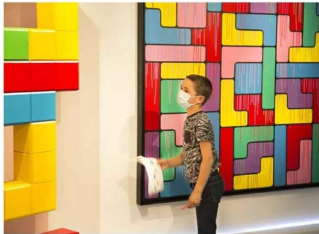
Exposition Mondes Imaginaires du street artiste Speedy Graphito Musée en Herbe

Figure internationale du Street Art, l'artiste plasticien Speedy Graphito est un drôle de touche-à-tout qui ne tarit pas d'idées créatives pop et colorées où l'absurde vient côtoyer les thématiques plus sérieuses de la consommation de masse et de l'écologie. Jusqu'au 6 novembre, le musée en Herbe accueille son exposition Mondes Imaginaires , compartimentée en cinq lieux magiques, dans lesquels les enfants évoluent progressivement, d'un conte initiatique à une virée chez les surréalistes. Les ateliers, pensés comme un prolongement de l'exposition, laissent libre cours à leurs imaginations bouillonnantes. Les Baby ateliers (de 2 à 4 ans) permettent à un parent et son jeune enfant d'expérimenter à quatre mains, et les Maxi ateliers (de 5 à 12 ans), aux plus grands de développer leur processus créatif.