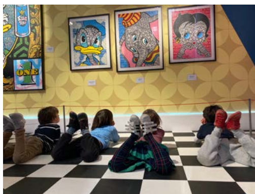
Exposition Mondes Imaginaires, 2021

Les activités du Musée en Herbe ont de nouveau été impactées par la crise liée à l'épidémie de coronavirus avec plus de quatre mois et demi de fermeture au public, de janvier à mai 2021.